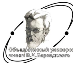
Ассоциация «Объединенный университет имени В.И. Вернадского»