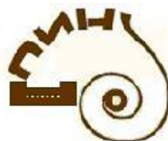
Палеонтологический институт имени А.А. Борисяка Российской Академии Наук