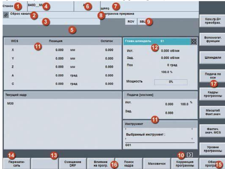
Рис. 1 - Окно – интерфейс программы SinuTrain

Запустить программу SinuTrain и описать интерфейс (рис.1)